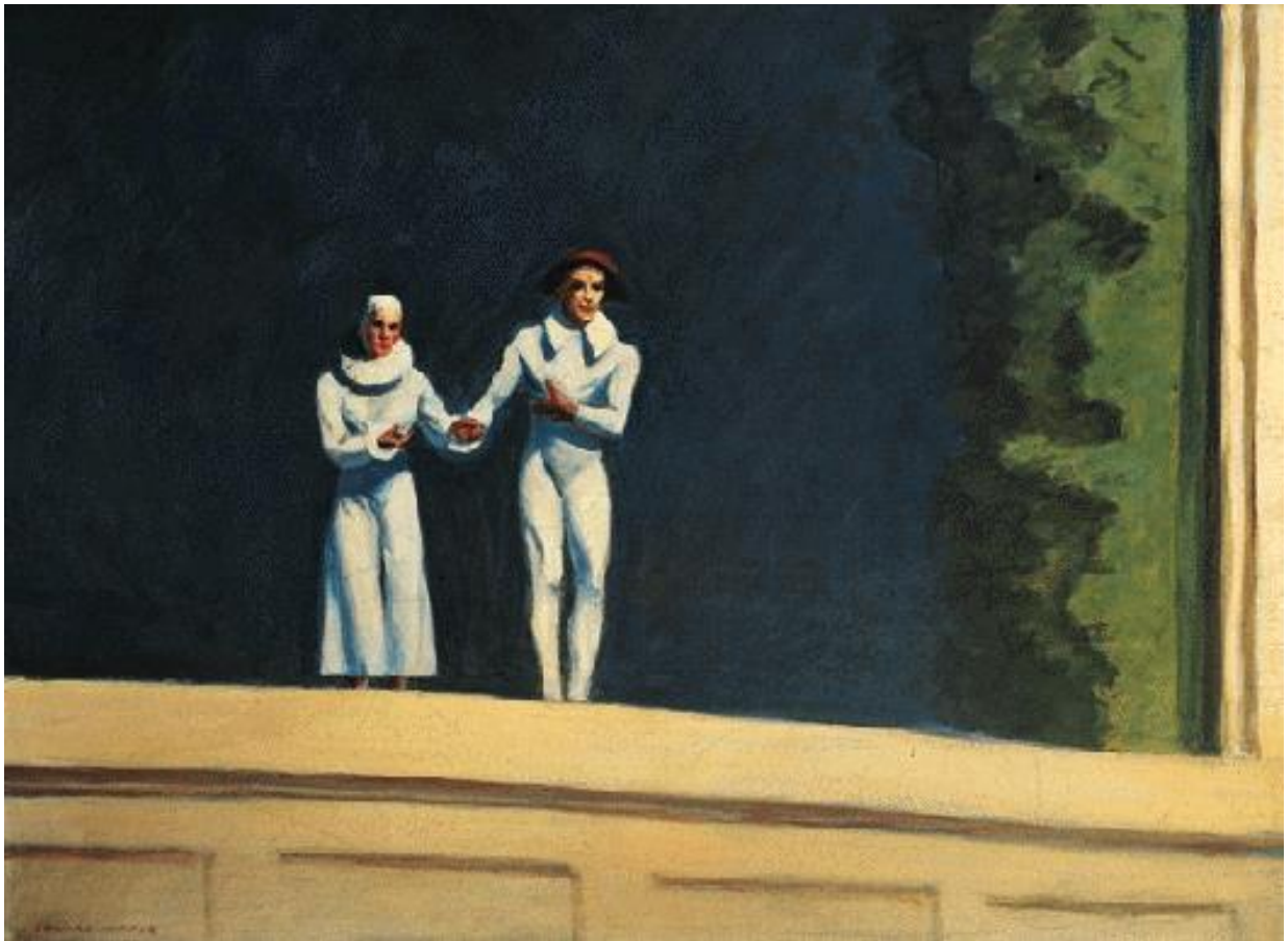
Edward Hopper, Two Comedians , 1965

Life's but a walking shadow; a poor player, That struts and frets his hour upon the stage And then is heard no more: it is a tale Told by an idiot, full of sound and fury, Signifying nothing.