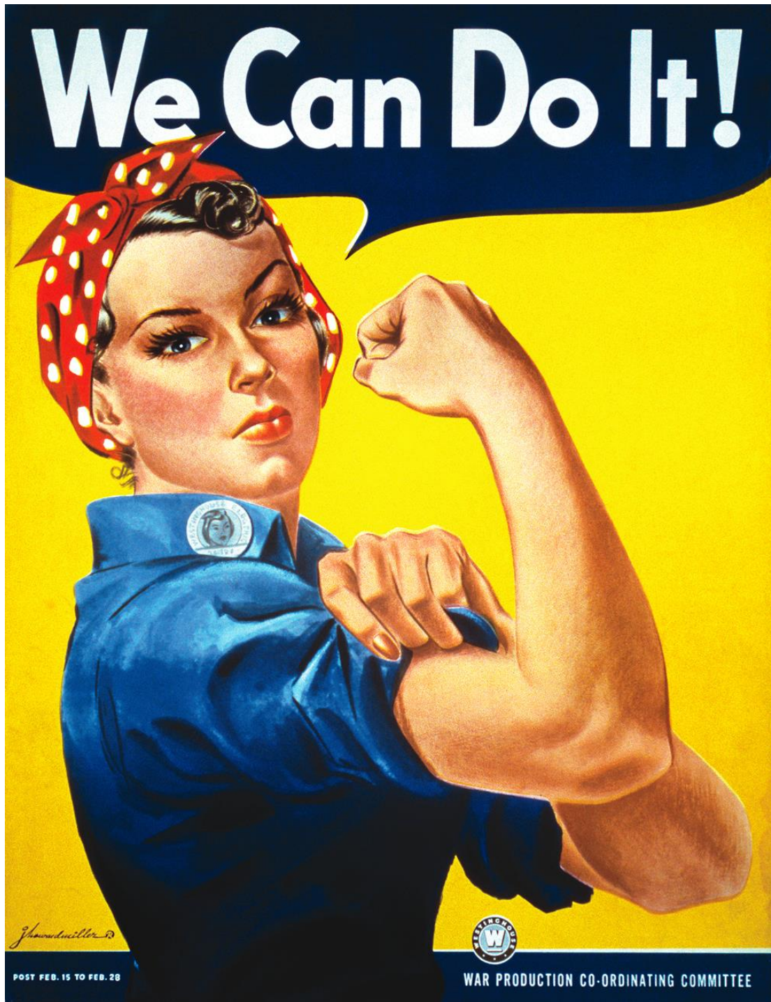
J. Howard Miller, We Can Do It! poster for Westinghouse, 1942.