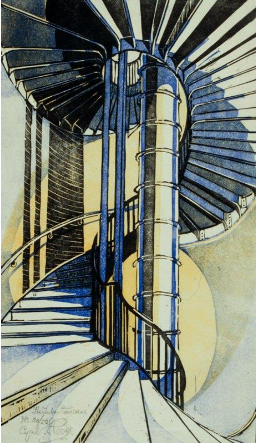
Cyril Edward Power, The Tube Staircase , c.1929