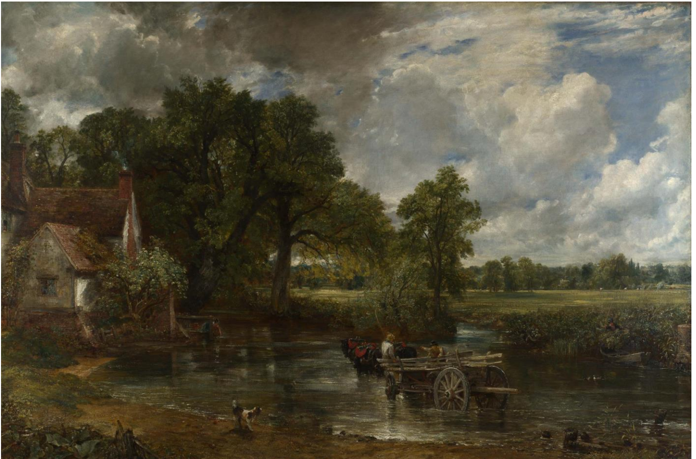
John Constable, The Hay Wain , 1821