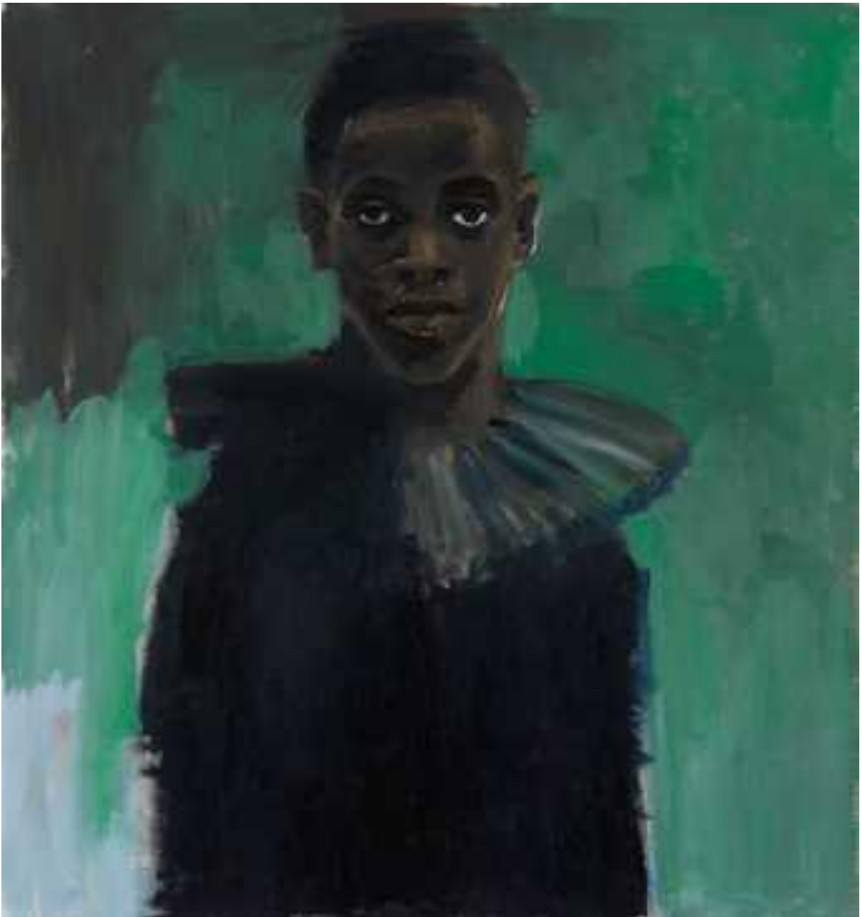
Lynette Yedom-Boakye, A Passion Like No Other , 2012