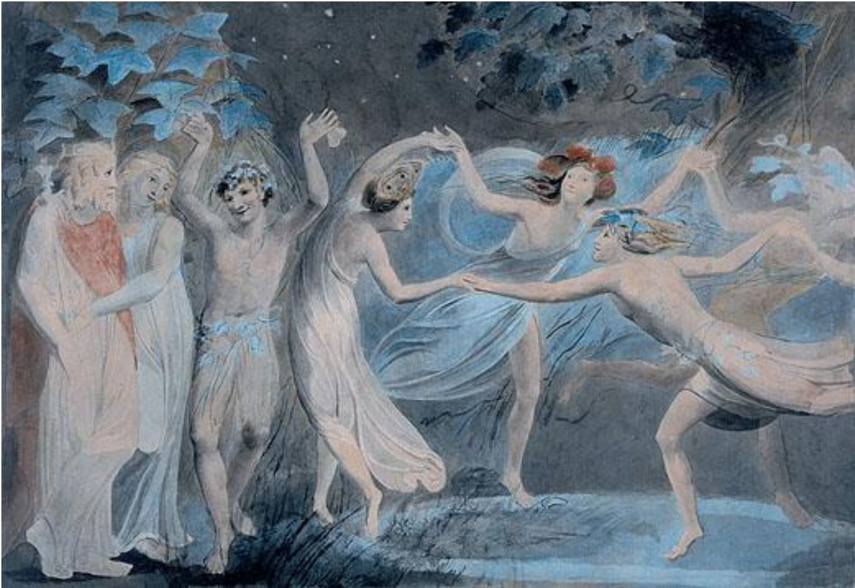
William Blake, Oberon, Titania and Puck with Fairies Dancing , c. 1786

A thing of beauty is joy for ever: Its loveliness increases; it will never Pass into nothingness.