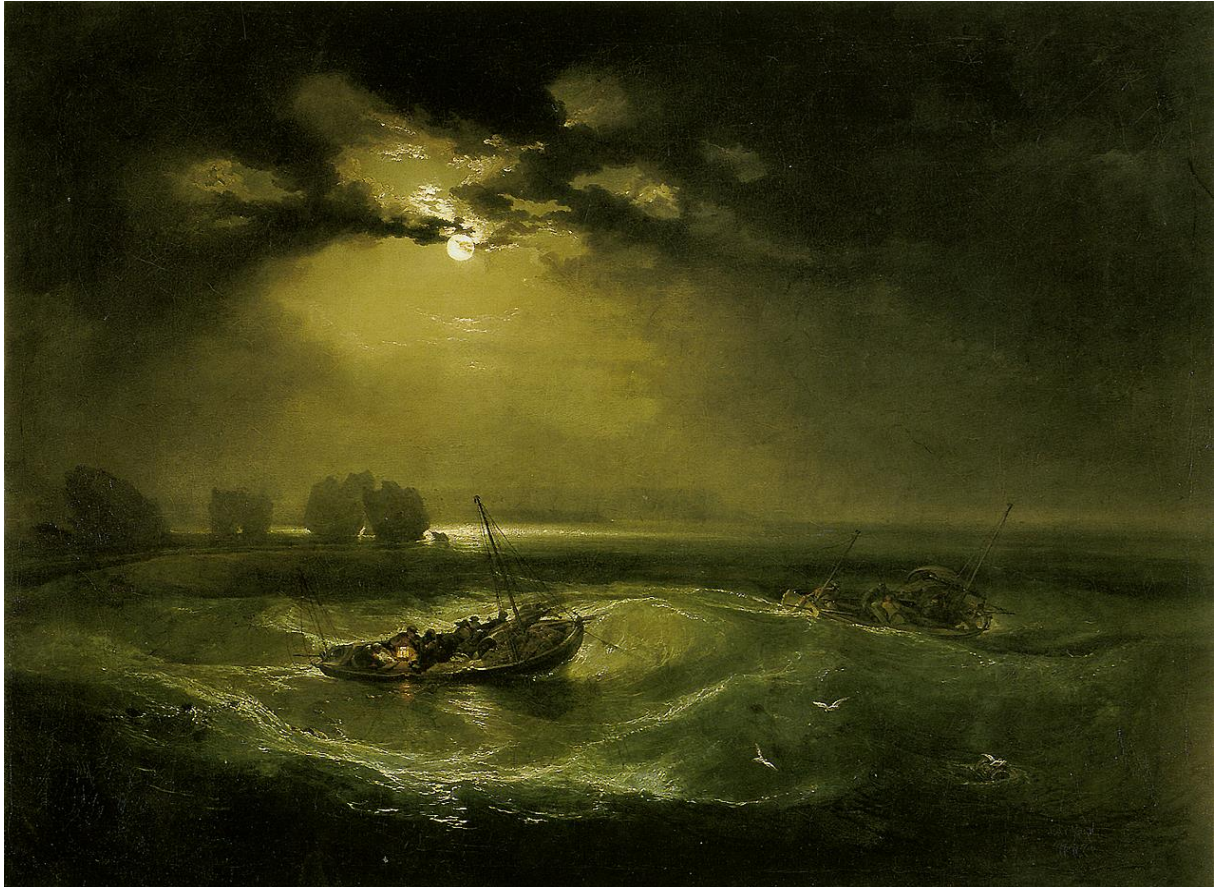
William M. Turner, Fishermen at Sea , 1796

‘None of them knew the color of the sky. Their eyes glanced level, and were fastened upon the waves that swept toward them.’