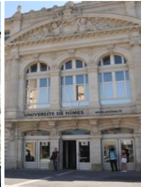
Site des CARMES