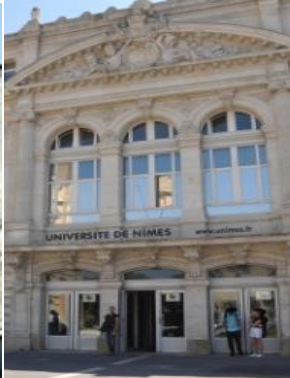
Site des CARMES