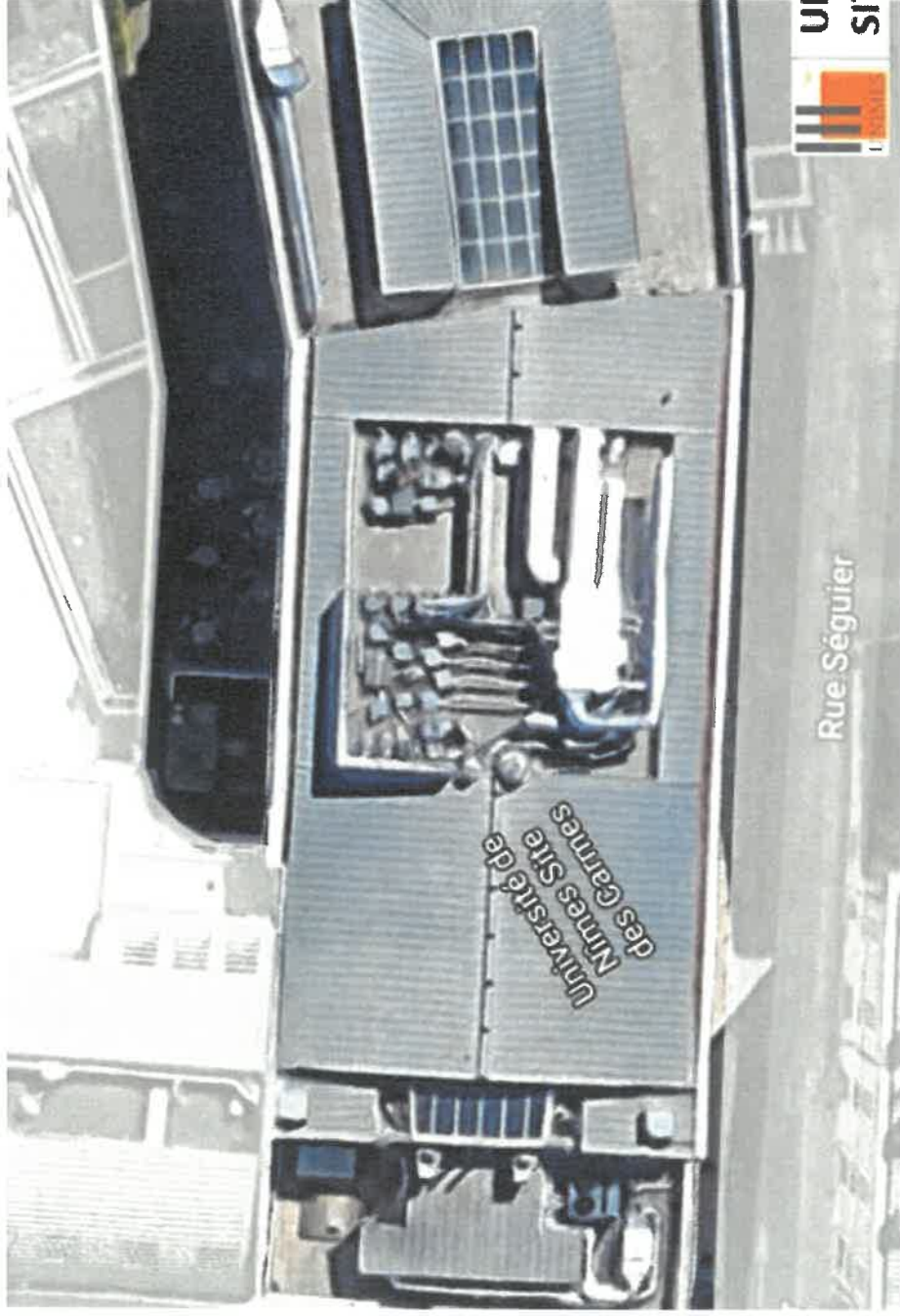
UNIVERSITE NIMES - Site des Carmes -