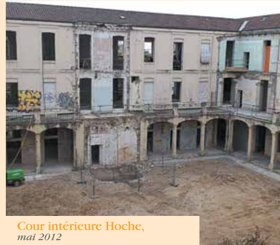
Cour intérieure Hoche, mai 2012

Ce projet de réhabilitation des anciens locaux et de construction de nouveaux espaces contigus entraînera la libération des sites des Carmes et de GIS, tous deux en location. Les économies d'échelle qui en découleront contribueront à une gestion plus efficace du parc immobilier universitaire.