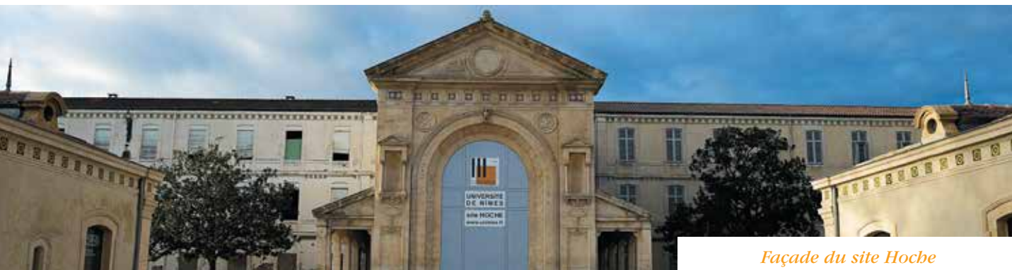
Façade du site Hoiche

Cette étape essentielle du développement de l'université de Nîmes a été rendue possible grâce au financement conjoint de l'État, de la Région Languedoc-Roussillon, du Département du Gard et de la Ville de Nîmes , inscrit au Contrat de plan Etat-Région 2007-2013 pour un montant global de 20,6 M€.