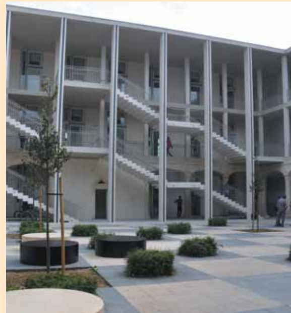
Cour intérieure Hoche, septembre 2013