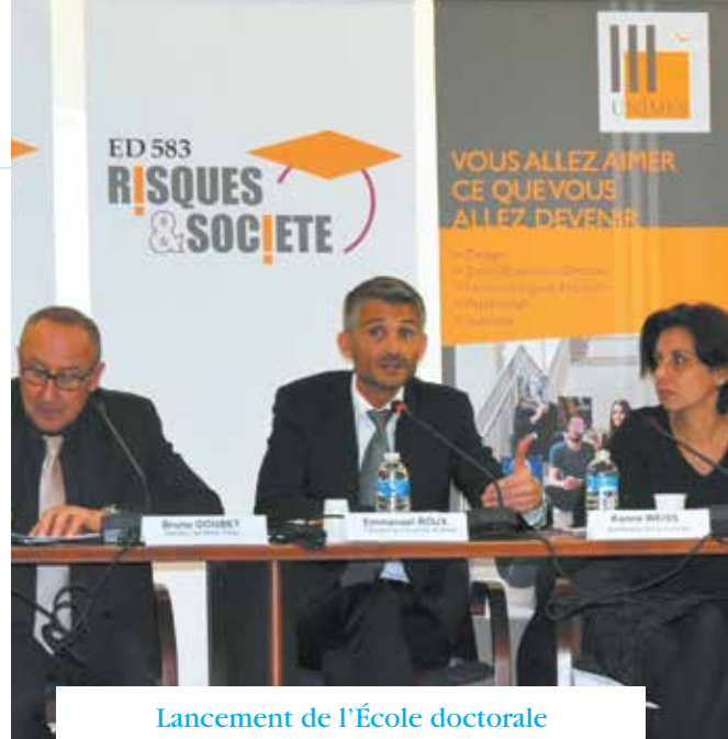
Lancement de l'École doctorale

Le 1 er septembre 2015, l'École Doctorale n°583 « Risques et Société » a ouvert ses portes à l'université de Nîmes. Co-accréditée avec l'École des Mines d'Alès, l'ED 583 « Risques et société » forme des doctorants dans la plupart des domaines thématiques enseignés à l'université de Nîmes. Elle collabore avec les laboratoires de recherche d'UNÎMES (CHROME) et de l'École des Mines d'Alès (LGEL, LGI2P) sur l'étude des risques dans leur dimension interdisciplinaire.