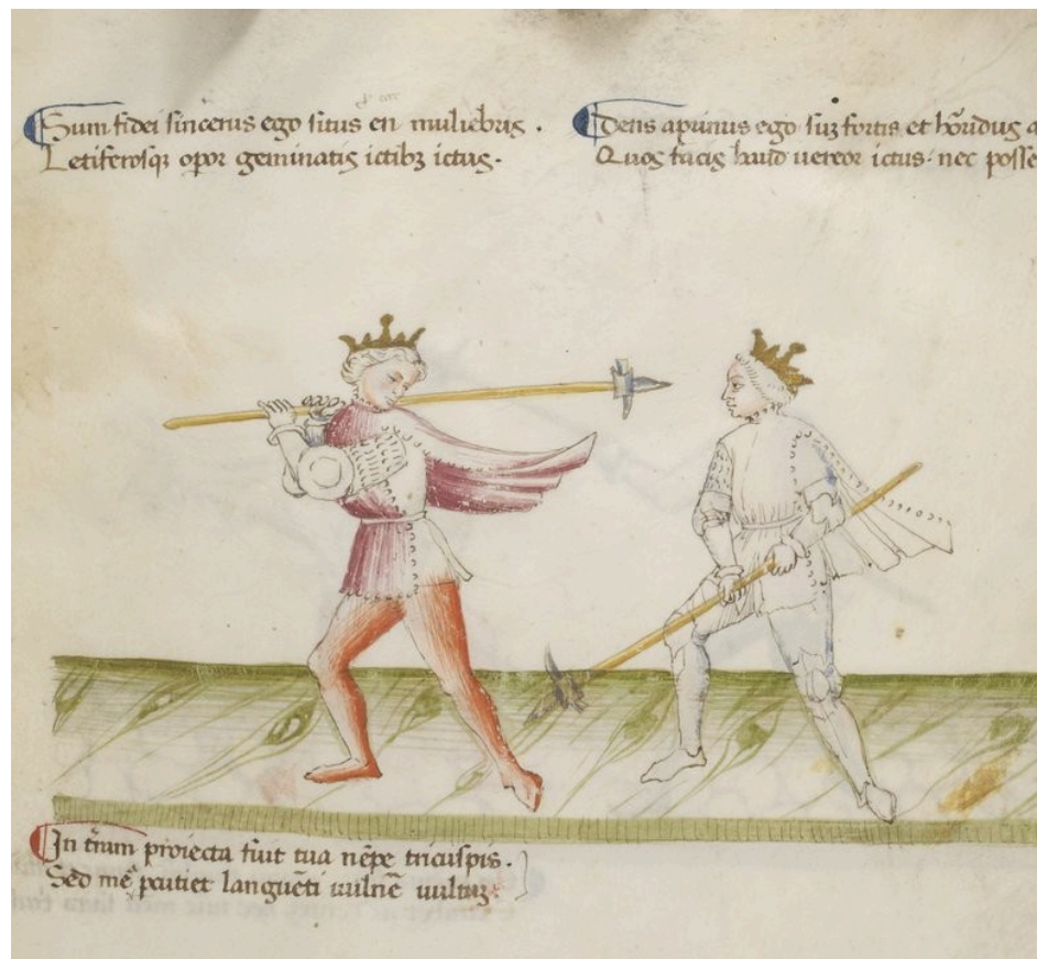
ms latin 11269